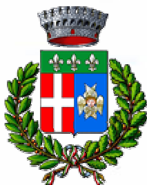
Comune di Sarnano